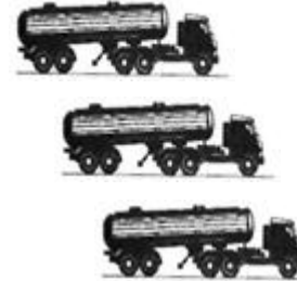
Доставка на АБЗ