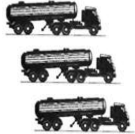
Отгрузка с НПЗ